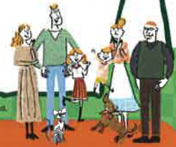
Illustration © LIXIL + SHLUSA. All Rights Reserved.

耐震化を高め、エコ住宅に長く住んでいただくために、持ち家の省エネ性能を向上させるリフォーム（エコリフォーム）に対して補助金がもらえます。リフォーム後の住宅が耐震性を有することが条件です。